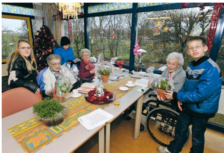
Dankzij het leefbaarheidsbudget konden kinderen kerststukjes maken voor ouderen.

'We hadden nog best moeite om de ouderen te vinden. Hun adresgegevens zijn vanwege privacywetgeving niet zomaar op te vragen', vertelt Erna. 'In samenwerking met stichting De Nieuwe Winst en via een mede-