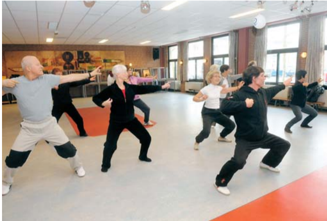
Tai chi 65+ in De Vuister

Het resultaat: een wijkuitvoeringsplan voor elke Zaanse wijk. Daarin staan de belangrijkste doelstellingen per wijk voor de komende vijf jaar. Inclusief de maatregelen die gemeente en partners willen nemen. De gemeente wil graag weten wat u van de doelstellingen en de voorgestelde maatregelen vindt. Op 16 mei (zie de uitnodiging op pagina 1) kunt u meedenken en -praten, en uw mening en ideeën laten horen. In onderstaande artikelen leest u kort wat de doelstellingen en maatregelen voor uw wijk zijn.