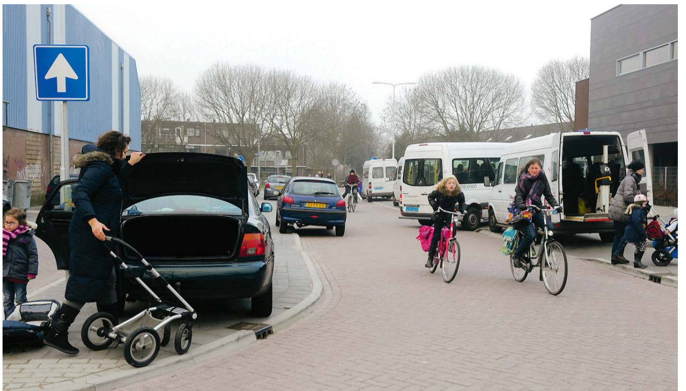
Onveilige situatie rond de scholen in Westerkoog.

lende verkeerssituaties rondom de scholen in Westerkoog in kaart brengen en kijken welke oplossingen er mogelijk zijn.